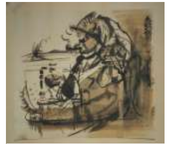
8. Farkas István utolsó önarcképe

Festményei világára ráillik Hofmannsthal megfogalmazása: „Búcsút kell vennünk egy világtól, mielőtt összeomlik. Sokan tudják már ezt... Különös szívvel járkálnak közöttünk, már mindentől eloldva, s legbelül mégis odaláncolva... Ami van, az számukra már nem létezik, aminek pedig jönnie kell, azt ajkuk képtelen kimondani. ”