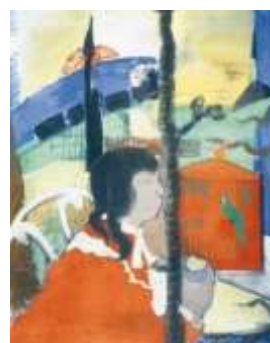
4. Farkas István: Vörös kalitka - 1928

A több kifejezésbeli szabadságot biztosító, könnyebben kezelhető olajtechnikák helyett áttér a temperára, a saját maga által gipsz és enyv keverékével fehérre alapozott kartonra illetve deszkára dolgozik. A technika körülményes ugyan, de a végeredmény: tiszta, ragyogó színek, nincs zsírfolt. A csendélet-sorozatban szintetikus kubizmusból indulva geometriai rácsot, logikai sémát alkalmaz.