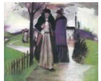
7. Farkas István: Sétány

Vissza-visszajár Párizsban fenntartott műtermébe, ám csak 1937-től