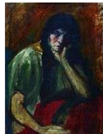
2. Farkas István: Ülő nő - 1919