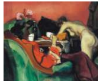
1. Farkas István: Várakozó modellek - 1920

Egy év múlva feleségül veszi a rendkívül művelt, kilenc nyelven olvasó, érzékeny festőt, báró Kohner Adolf bankár, földbirtokos, műgyűjtő lányát. 1924-ben rendezi meg 117 képből álló első önálló kiállítását az Ernst Múzeumban. 1924 novemberében Farkas feleségével együtt a húszas évek eleji „bolond évek”, a dzsessz és Josephine Baker, amerikai írók, gyűjtők látogatta kávéházak, kocsmák Párizsába érkeznek. A Montparnasse-on bérel műtermet, látogatja a művészkávéházakat, esténként dobol a Sélectben, afrikai szobrokat gyűjt. Folytatja szénrajz kávéházi és páholy-sorozatát, melyek kevésbé kapcsolódnak a naturához, mint otthon, kikísérletezi, hogy az elhagyások, ívelt és derékszögű vonalak, befejezetlen, üresen hagyott felületek, épp csak jelzesszerű formák, az összevonások, absztrahálások hogyan befolyásolják a kompozíciót.