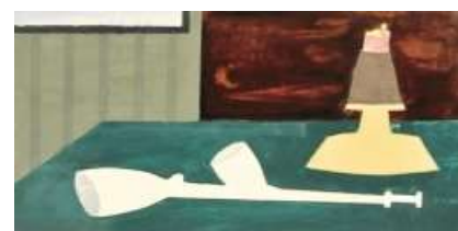
5. Farkas István: Pipás csendélet - 1926