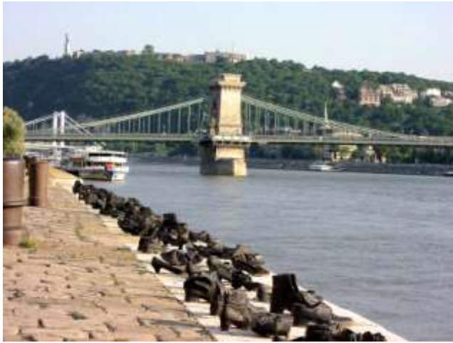
A Duna-parti nyilas sortűzök emlékét őrzik a parton elhelyezett cipők.

Richter Gedeon egész életében az emberek szolgálatában tevékenykedett. Azon dolgozott,