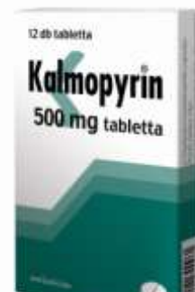
Idén, 2012-ben van a Kalmopyrin tabletták piacra bocsátásának 100. évfordulója

Az I. világháború után, a Tanácsköztársaság idején Richter gyárát kisajátították, s élére termelési biztost neveztek ki. Együttműködést próbáltak belőle kicsikarni, ő azonban családjával Szegedre menekült apósához. Később aztán a szegedi kormány egészségügyi miniszterének megbízásából Bécsbe utazott, hogy gyógyszereket s alapanyagokat szerezzen be. 5